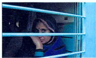
■ Cœur de tigre de Caroline Champetier.

rité : le travail en solitaire de Caroline Champetier, dans la mise en danger permanente d'elle-même, a souligné à quel point les lycéens, contraints au tournage en groupe, au sein de l'institution scolaire, avaient en partie buté sur cette quête de l'intime propre à l'écriture épistolaire. Impossible de prendre des risques en classe ?